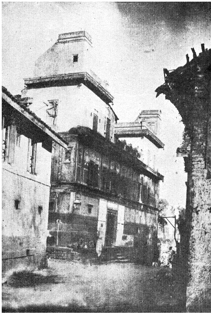
‘ काळाचें ’ जन्मस्थान सरदार कानड्यांचा ( कौनकरांचा ) वाडा